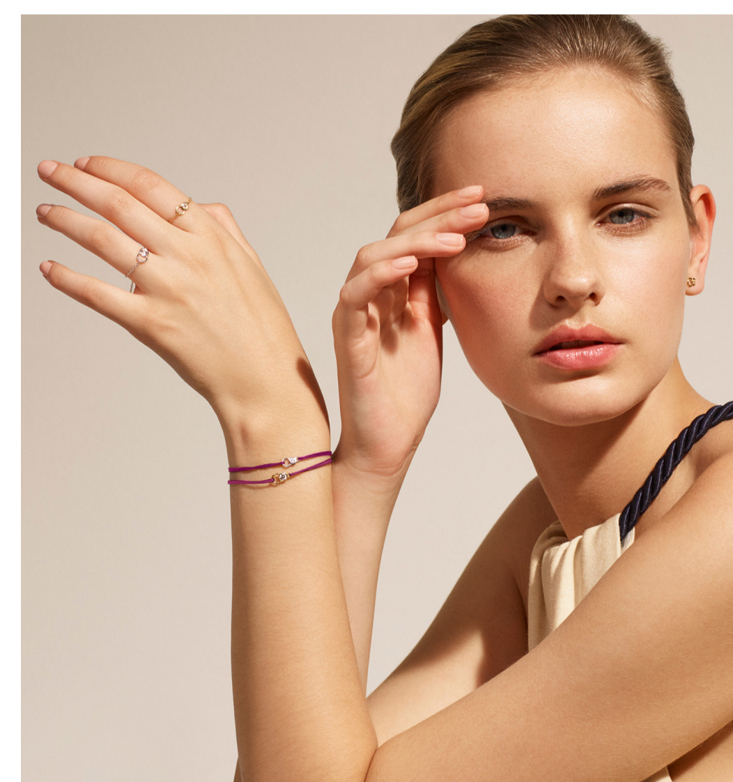
Bracelet Let's Commit Bois de rose en or recyclé et diamant de culture de 0,05 ct, créé en laboratoire, 390 €, Courbet. Bracelet Let's Commit Bois de rose en or recyclé et diamant de culture de 0,15 ct, créé en laboratoire, 490 €, Courbet.